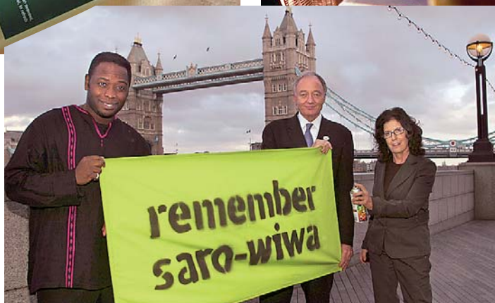
Anita Roddick i Ken Livingston, gradonačelnik Londona, sudjelovali su na skupu posvećenom Kenu Saru-Wiwu, pogubljenom nigerijskom novinaru, borcu za ljudska prava

nosti. Napisala je nekoliko knjiga, među kojima i svoju biografiju. Dobitnica je prestižnih nagrada za poslovno vođenje i za svoj aktivizam. Za sebe kaže da što je starija postaje radikalnija. - Nemoguće je odvojiti vrijednosti kompanije od mojih osobnih vrijednosti, od pitanja koja su meni bitna - društvene odgovornosti, poštovanja ljudskih prava, zaštite okoliša i životinja kao i poticanje poštene trgovine s primitivnim zajednicama. Na Sveučilištu Bath 1997. pokrenula je Novu poslovnu akademiju, magistrski program koji se temelji na idejama korporativne odgovor-