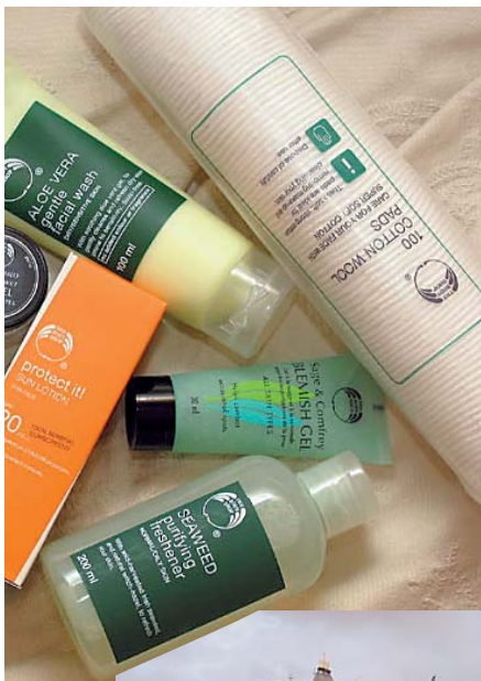
Što sam starija, to sam radikalnija, kaže za sebe neumorna Anita Roddick